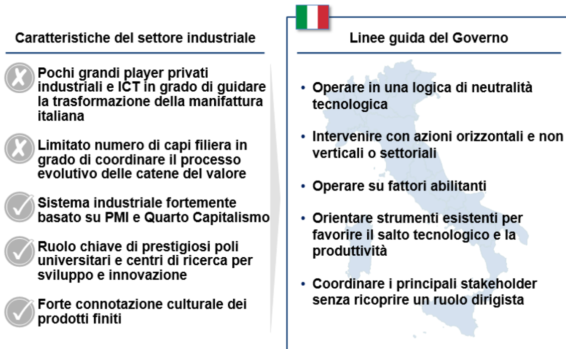
Figura 1: Industria 4.0: il modello italiano

In quest'ottica, con il Piano Nazionale Industria 4.0 , il Governo intende sostenere il processo di trasformazione delle imprese italiane che vogliono cogliere le opportunità legate alla quarta rivoluzione industriale. Il Piano ha il suo presupposto nell'analisi della struttura dell'economia italiana: